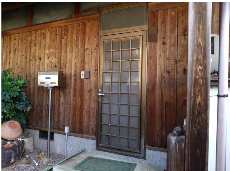
対象不動産の内部