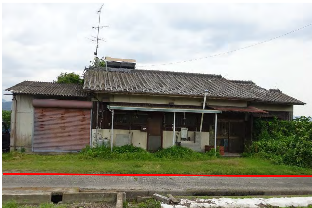
対象不動産の北側より撮影