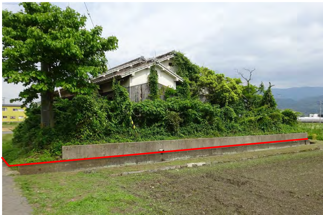
対象不動産の北西側より撮影