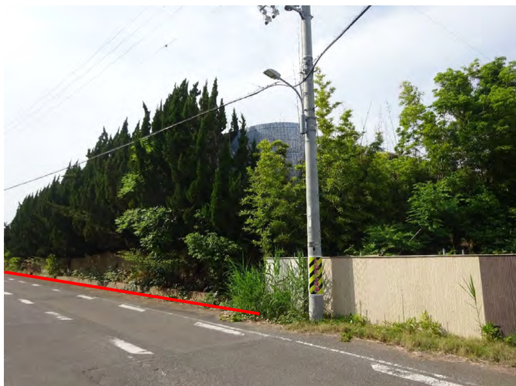
対象不動産の南西側より撮影