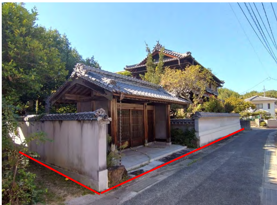
対象不動産の南東側より撮影