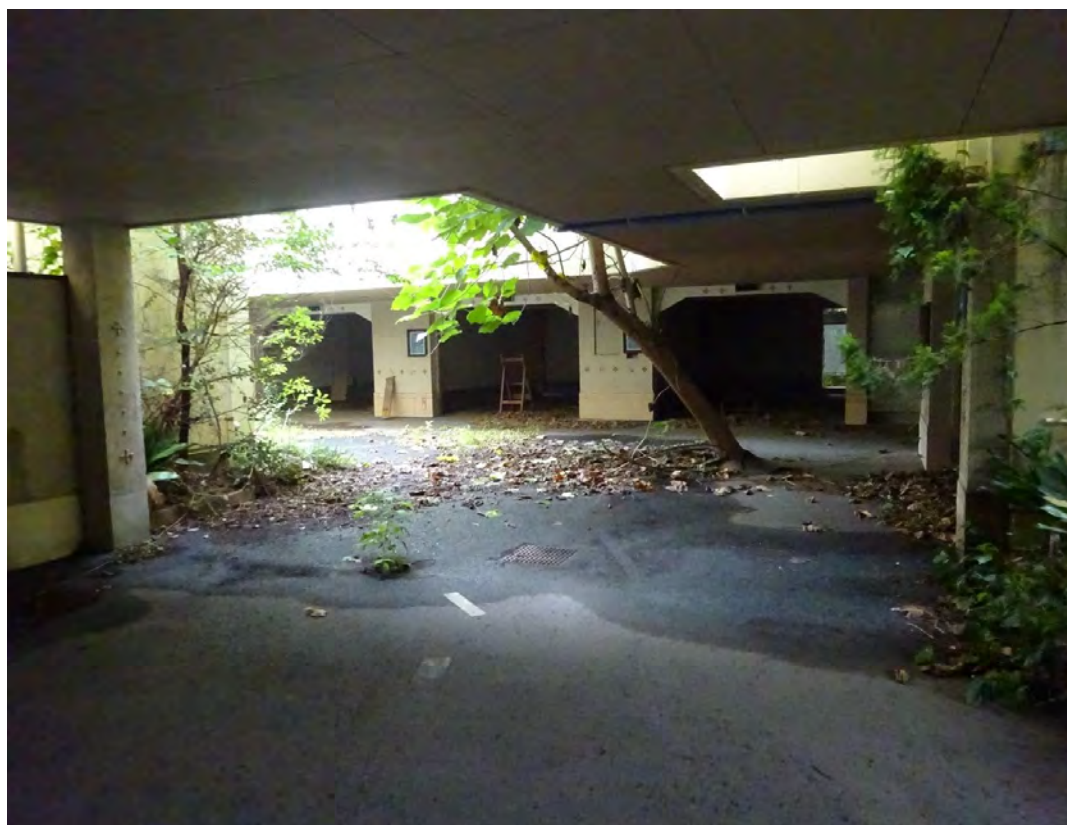
対象不動産内部の入口付近より撮影