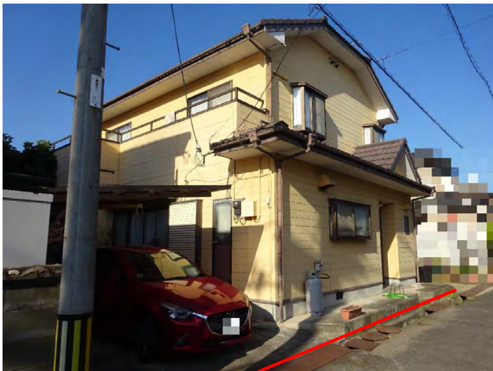
対象不動産の南東側より撮影