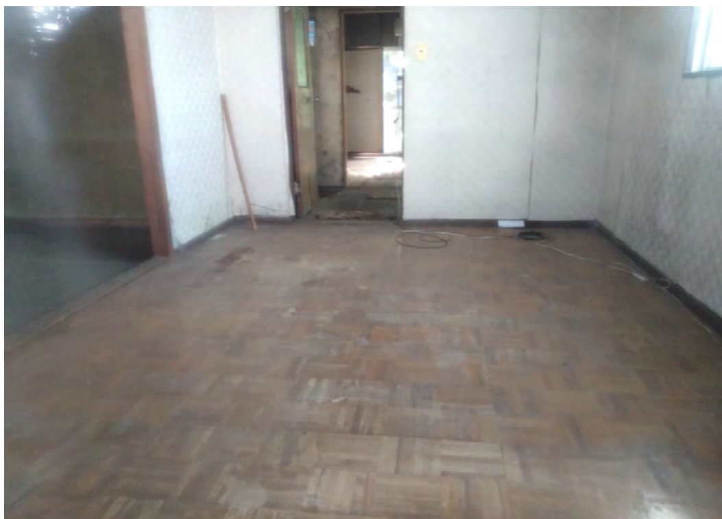
対象不動産の内部