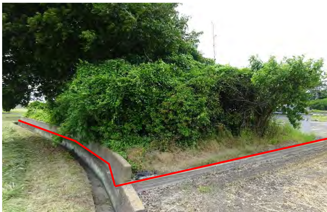
対象不動産の南東側より撮影