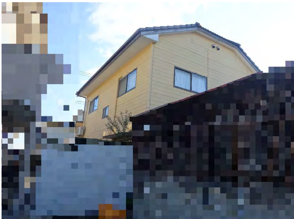
対象不動産の北西側より撮