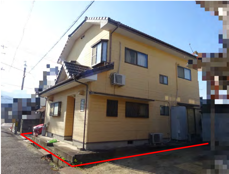
対象不動産の北東側より撮影