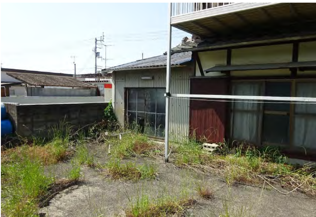
対象不動産の南側より撮影