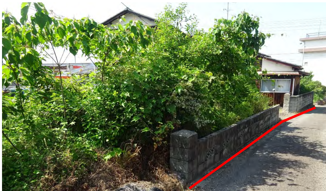
対象不動産の南東側より撮影