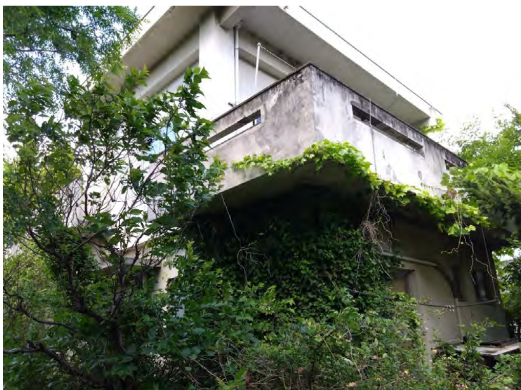
対象不動産の西側より撮影