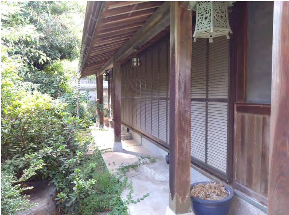
対象不動産の内部