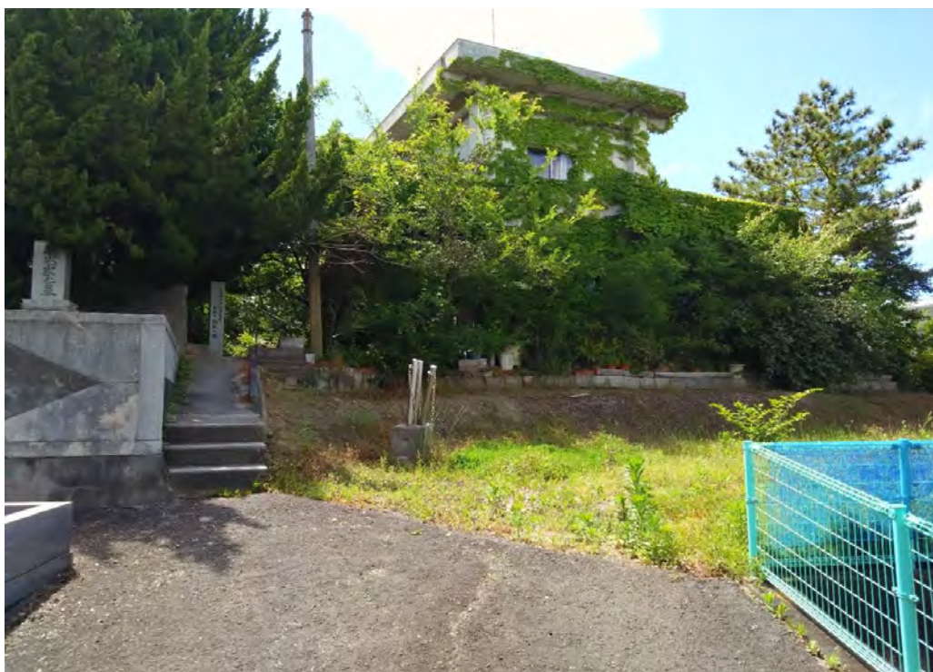
対象不動産の東側より撮影