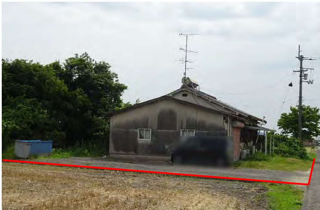
対象不動産の北東側より撮影