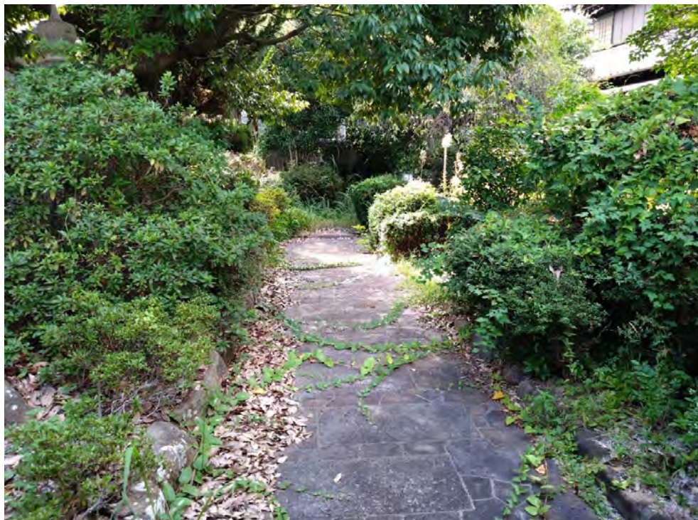
対象不動産の内部