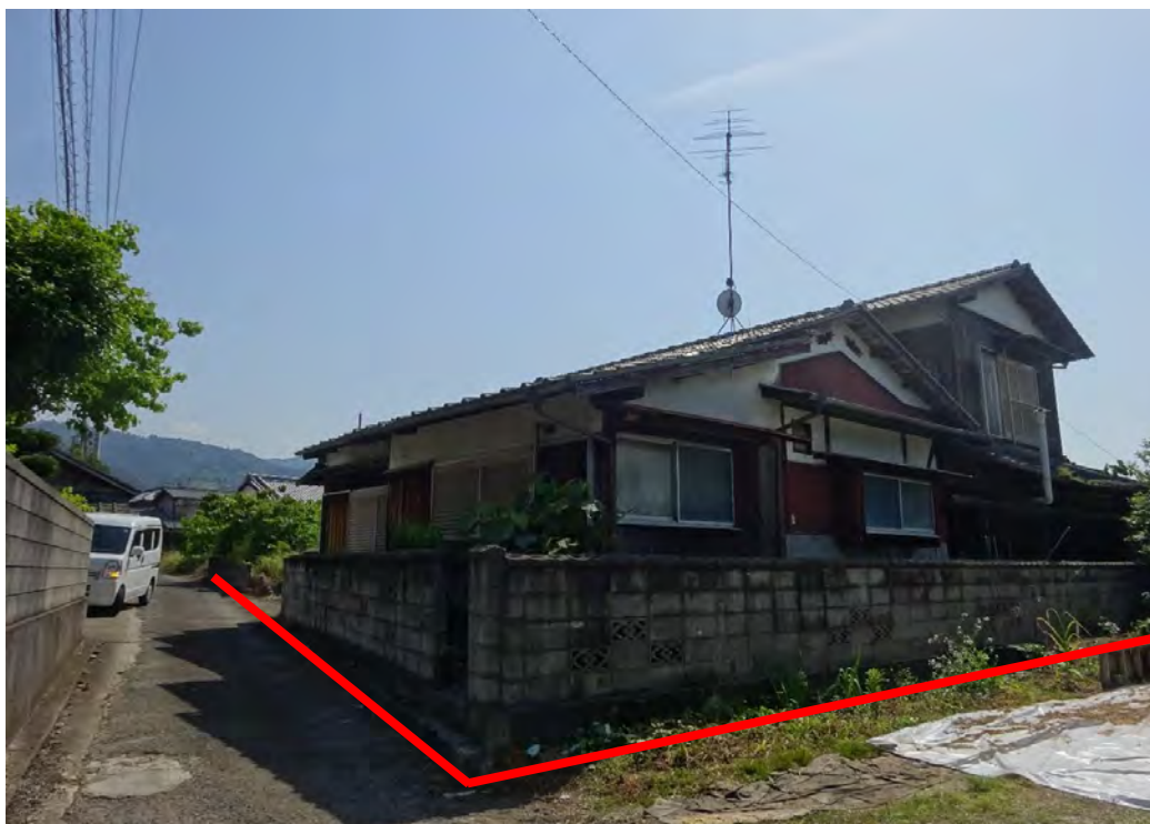
対象不動産の北東側より撮影