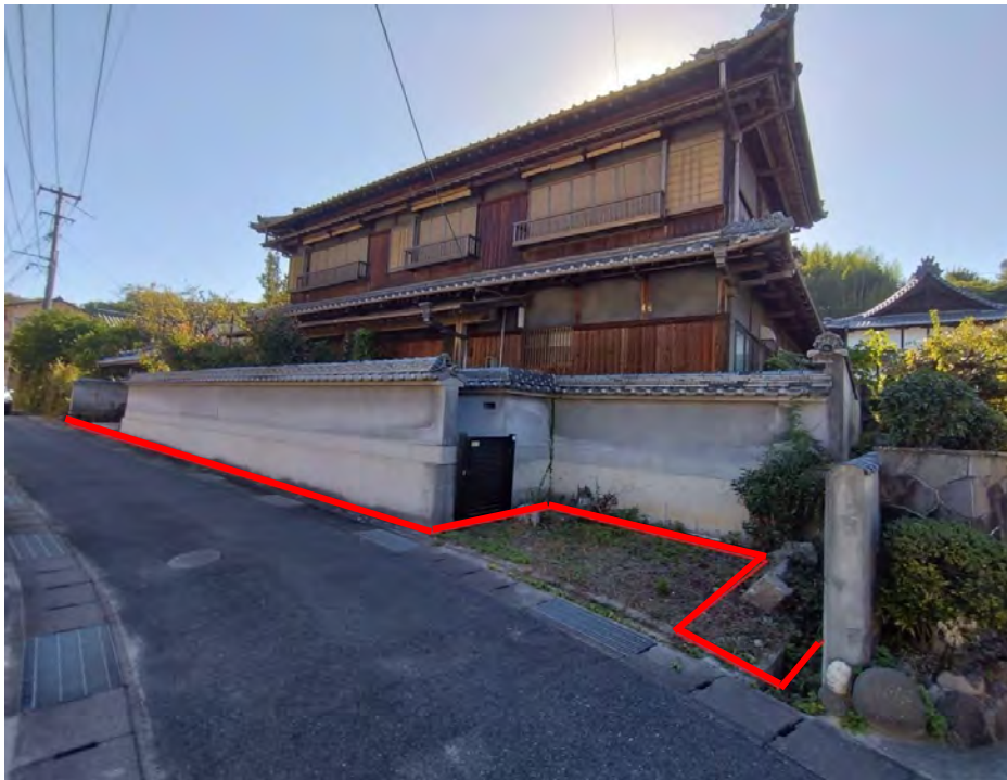
対象不動産の北東側より撮影