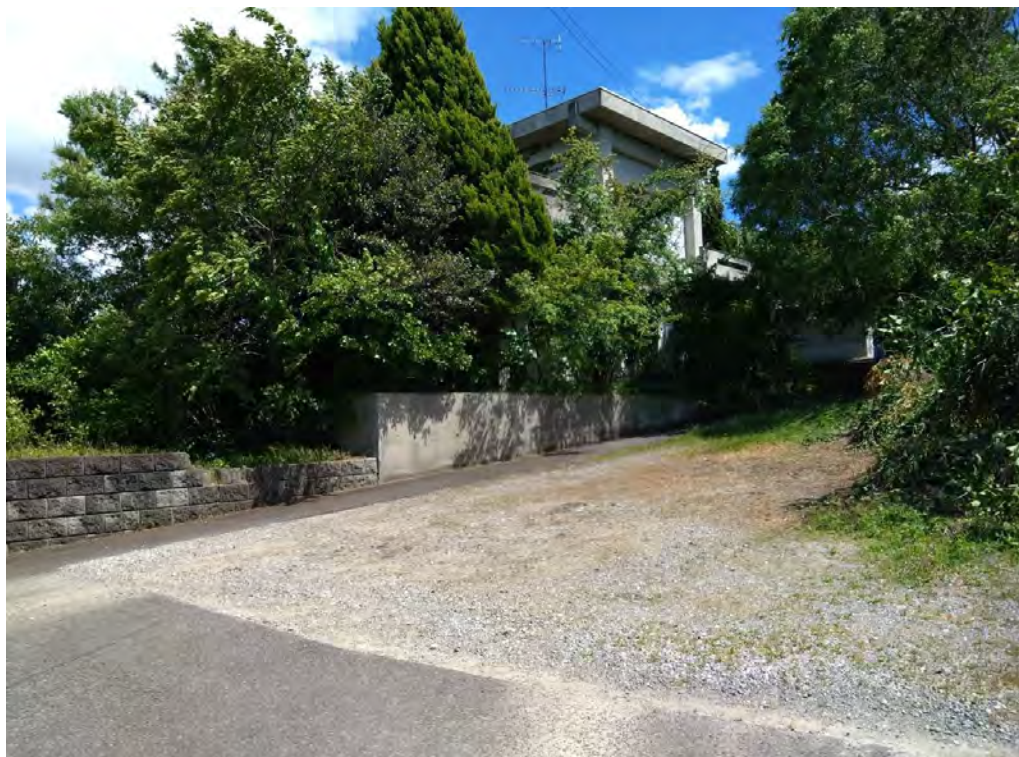
対象不動産の北西側より撮影