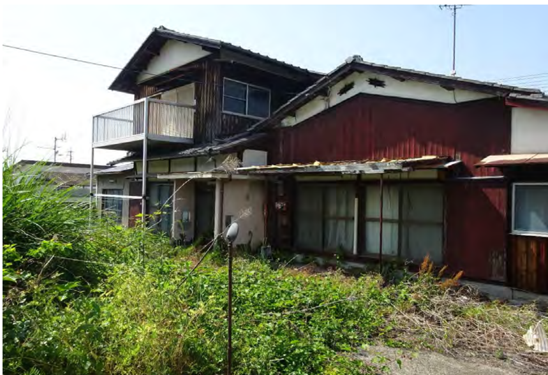
対象不動産の南東側より撮影