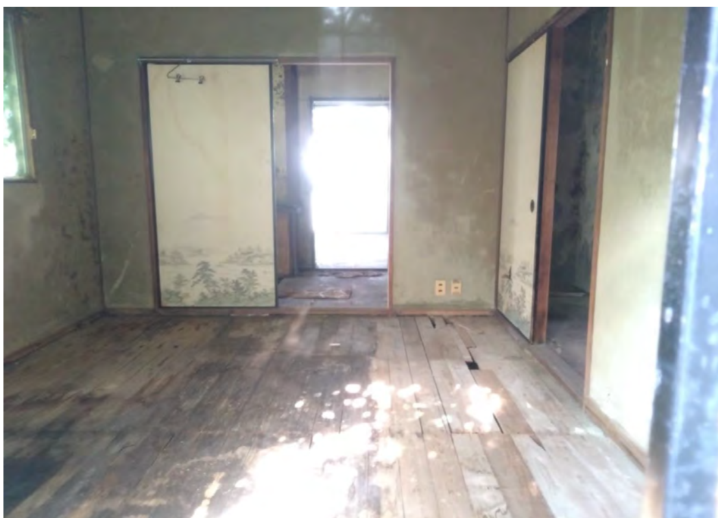
対象不動産の内部