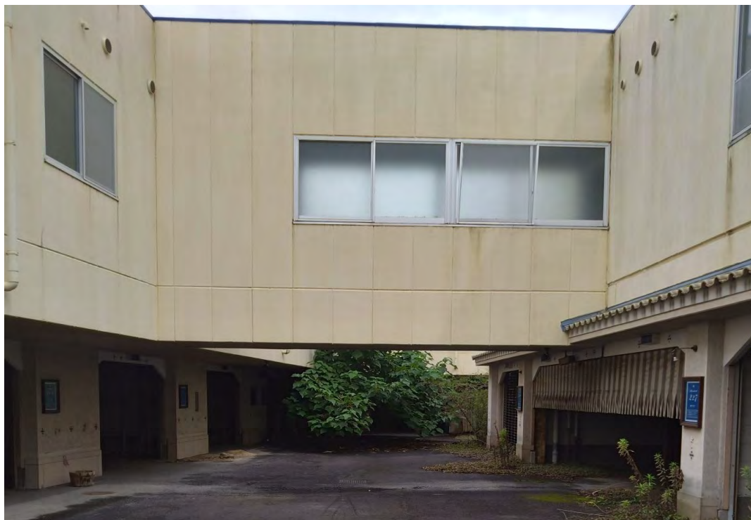
対象不動産内部の南側より撮影