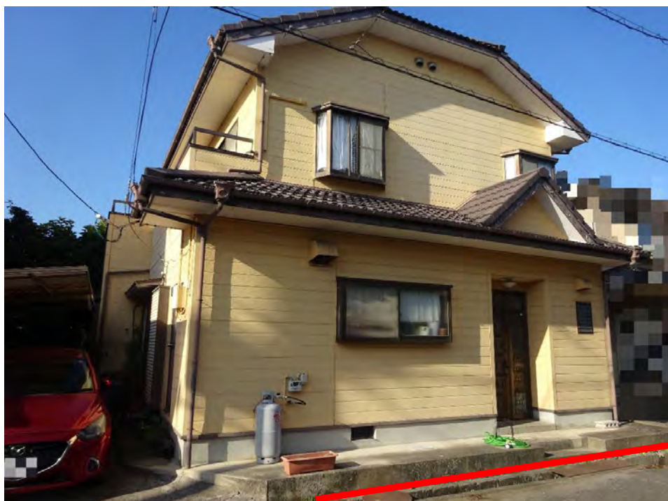
対象不動産の西側より撮影