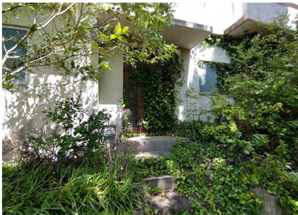
対象不動産の玄関前