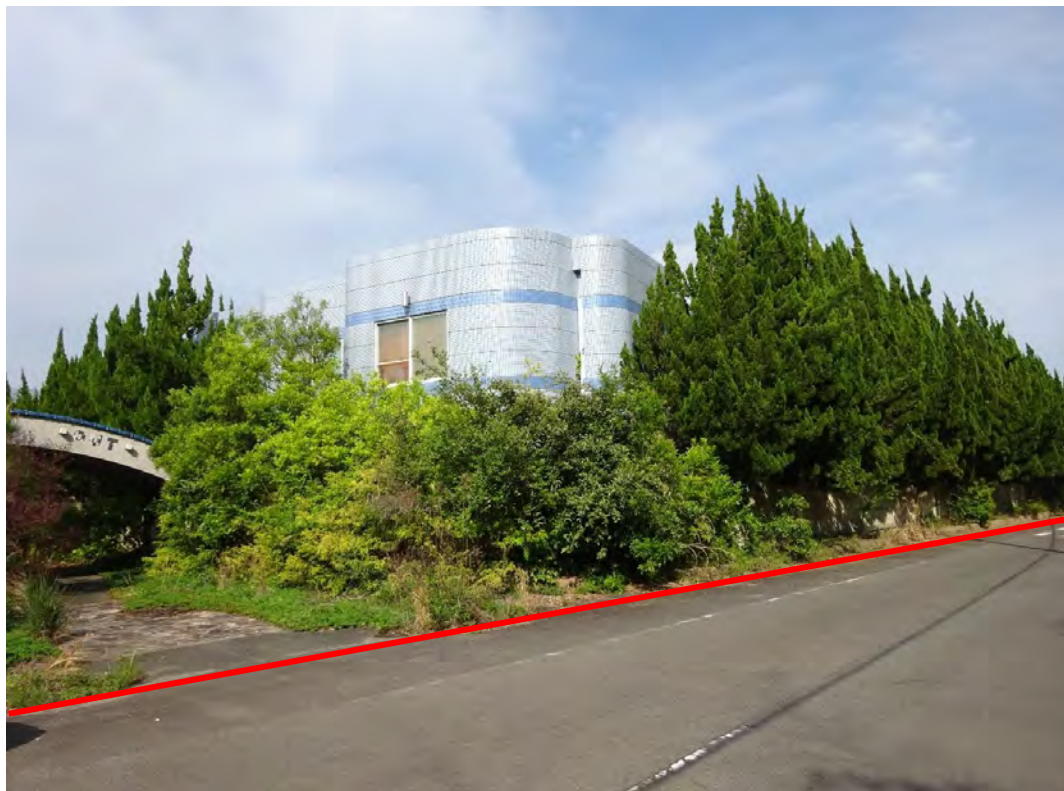
対象不動産の北西側より撮影