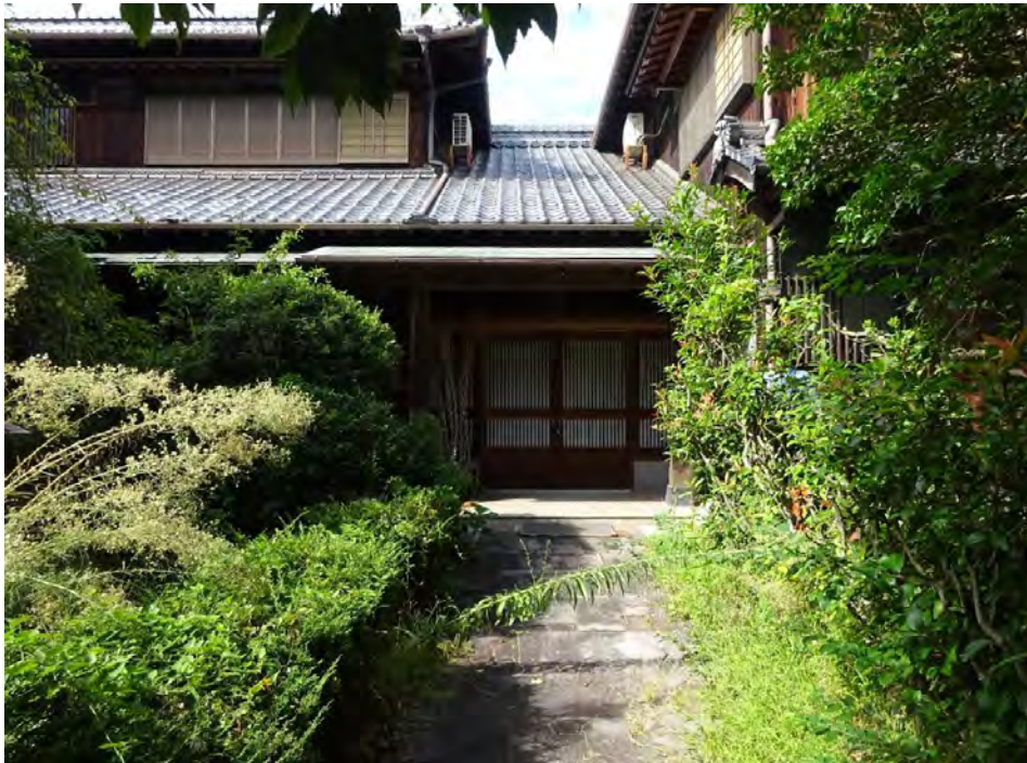
対象不動産の内部